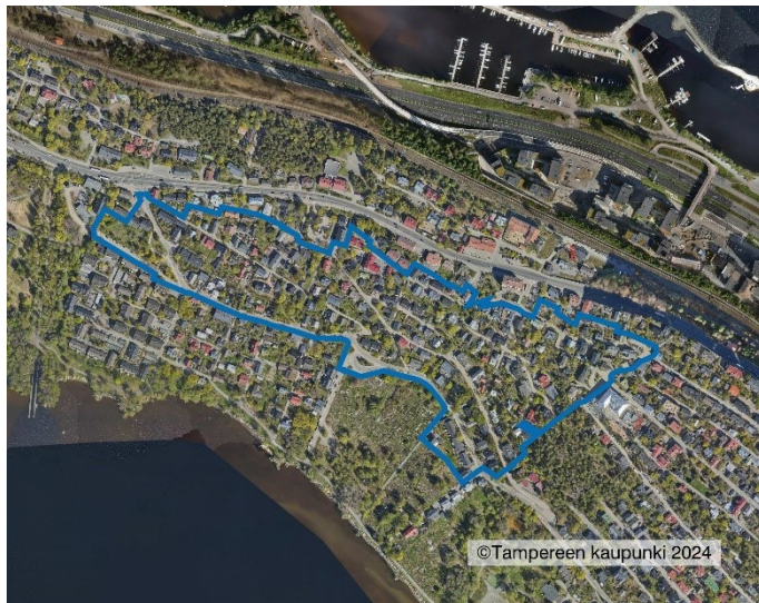
Kaava-alue rajattuna ilmapuuvaa